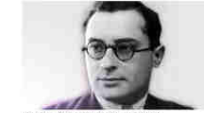
Jean Zay (1904-1944)

Avant d'aller plus loin dans ces notions de cultures, voici une photo très culturelle : la panthéonisation de Pierre Brossolette, Geneviève De Gaulle, Germaine Tillon et Jean Zay.