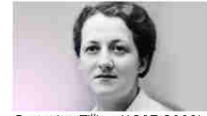
Germaine Tillon (1907-2008)