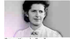
Geneviève de Gaulle Anthoinoz (1920-2002)