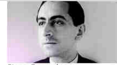
Pierre Brossolette (1903-1944)

http://pantheon2015.culturecommunication.gouv.fr/La-ceremonie-d-entree-au-Pantheon