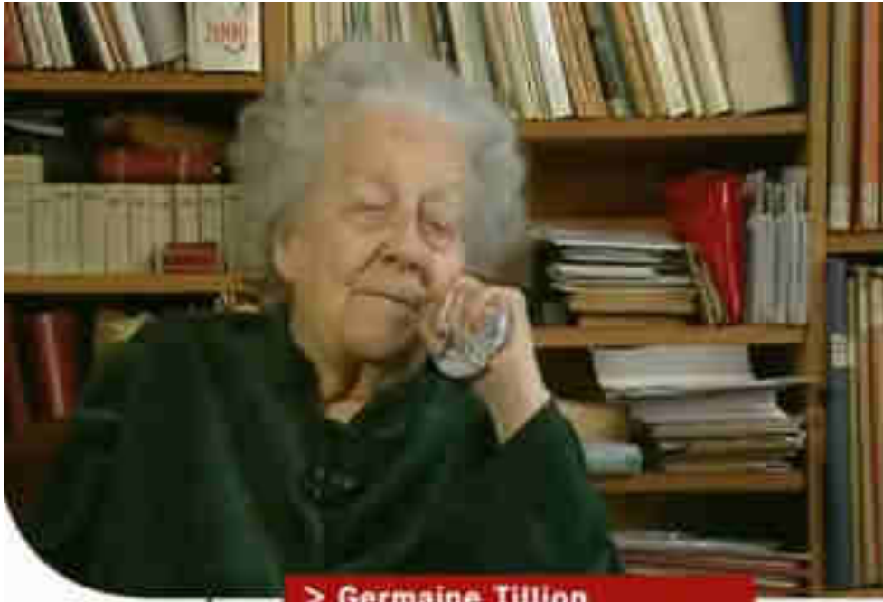
> Germaine Tillion